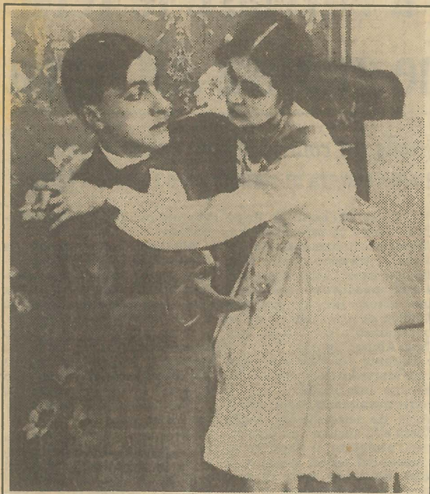
Vladimir Majakovskij e Lili Brik in una scena di «Incantati dal Film», un'opera cinematografica del 1918